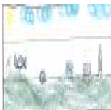
Un mal ambiente, Esteban Hincapié