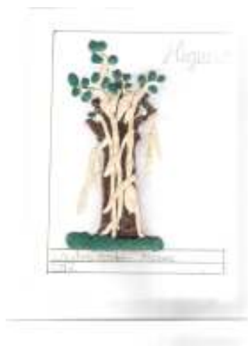
Higuera estranguladora por Carlos Andrés Álvarez.

Una vez seleccionada la imagen, colóquela cerca del artículo. Asegúrese de que el pie de imagen está próximo a la misma.