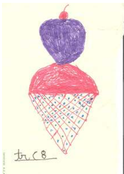
Transición C # 8

Hace mucho tiempo en una galaxia muy lejana había una guerra entre el bien y el mal. Murieron muchos pero el bien ganó.